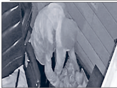
बहादुरगढ़। दरवाजा से पैसे निकालता चोर।