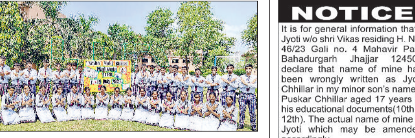
झज्जर। कार्यक्रम में एकत्रित विद्यार्थी।