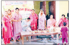
झज्जर। शिविर में उपस्थित ग्रामीण एवं स्वास्थ्यकर्मी।