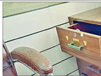
बहादुरगढ़। चोरों द्वारा खंगाली गई दरवाजा।

वारदात का पता चला। शटर के ताले टूटे हुए थे और अंदर शीशे के दरवाजों के लॉक भी टूटे हुए थे। काउंटर का सामान बाहर बिखरा पड़ा था। उसमें