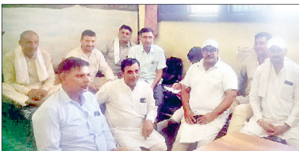
झंझर। रोडवेज कर्मचारी यूनियन की बैठक में मौजूद कर्मचारी।