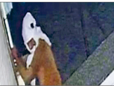
बहादुरगढ़। शटर खोलता नजर आ रहा चोर।